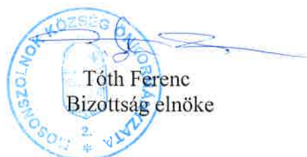
Tóth Ferenc Bizottság elnöke